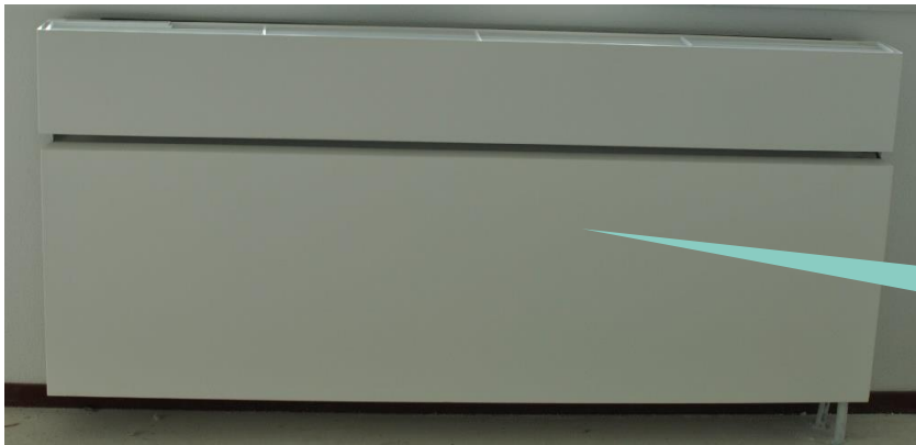
Horizontale radiator in woonkamer/studio

Dit apparaat ziet eruit als een radiator, maar zorgt voor verwarming én ventilatie. Met de thermostaat op de wand regel je de temperatuur.